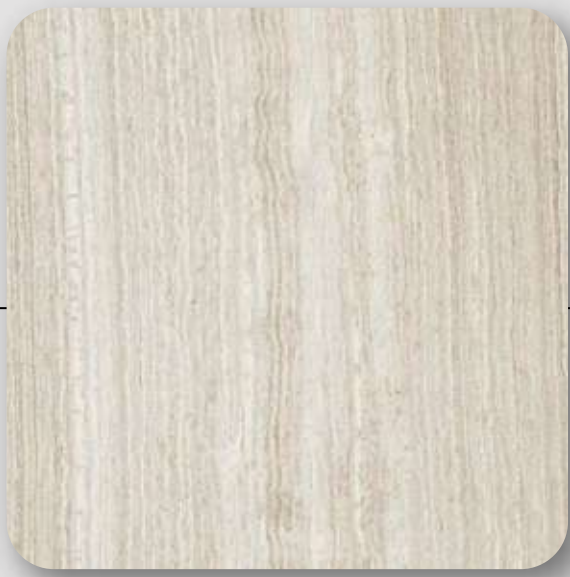
Cerámico Thassos travertine, modelo roman, marca interceramic, formato 40x60 cm