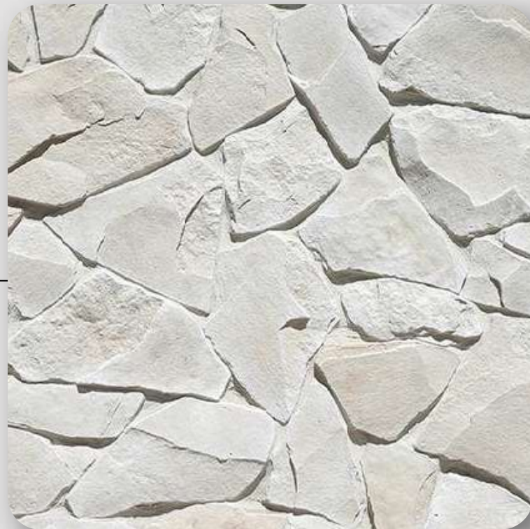
Piedra laja con junta vaciada y secciones con juncos

Debido a que el desarrollo se encuentra en proceso, algunos acabados podrían variar sin comprometer la calidad en el proyecto, dichos cambios pueden ocurrir sin aviso previo.