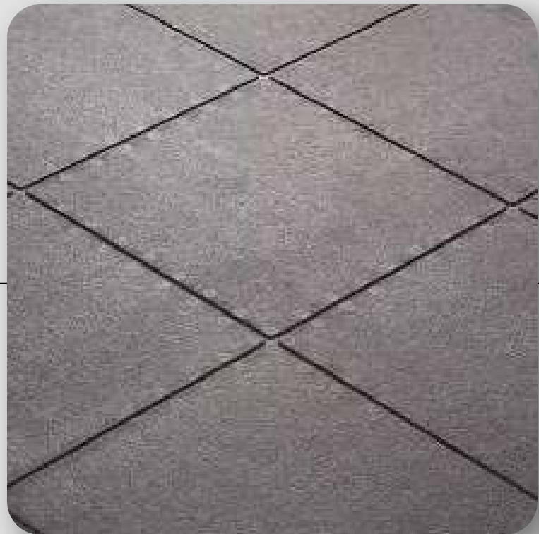
Piso de caucho montado sobre concreto pulido