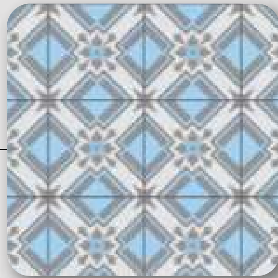
Muro de cocineta con mosaico de cemento modelo Destello marca Laguna Mosaicos de 20 x 20 cm

Debido a que el desarrollo se encuentra en proceso, algunos acabados podrían variar sin comprometer la calidad en el proyecto, dichos cambios pueden ocurrir sin aviso previo.