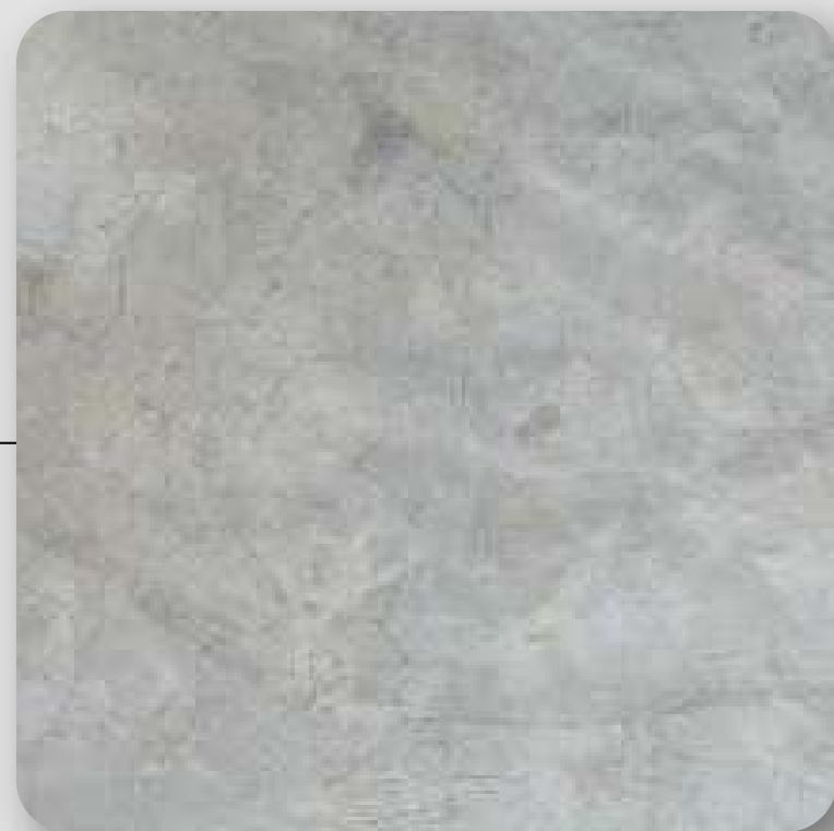
Concreto pulido con matices gris oxford y blanco

Debido a que el desarrollo se encuentra en proceso, algunos acabados podrían variar sin comprometer la calidad en el proyecto, dichos cambios pueden ocurrir sin aviso previo.