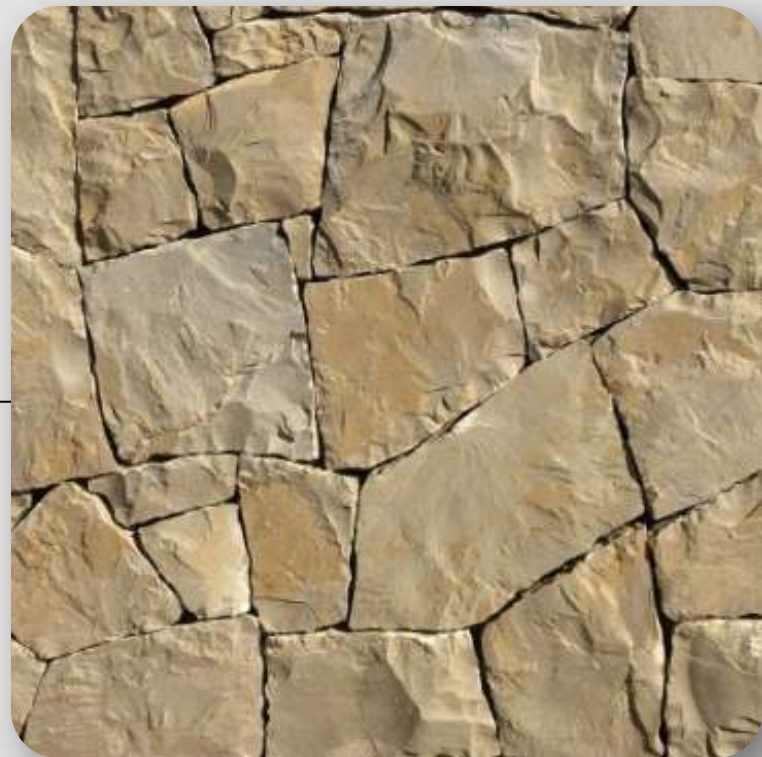
Piedra careada con junta vaciada

Debido a que el desarrollo se encuentra en proceso, algunos acabados podrían variar sin comprometer la calidad en el proyecto, dichos cambios pueden ocurrir sin aviso previo.