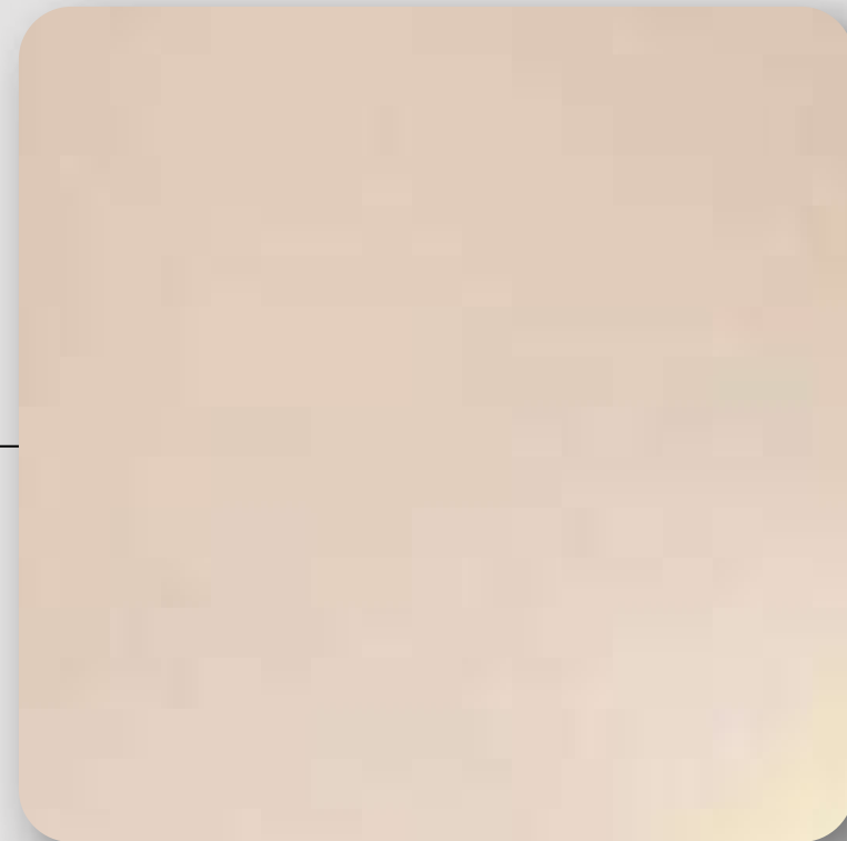
Muros en terminado gyplast

Debido a que el desarrollo se encuentra en proceso, algunos acabados podrían variar sin comprometer la calidad en el proyecto, dichos cambios pueden ocurrir sin aviso previo.