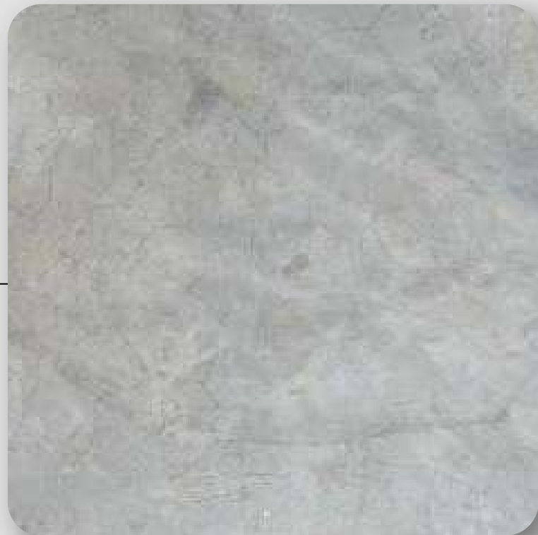
Concreto pulido con matices gris oxford y blanco

Debido a que el desarrollo se encuentra en proceso, algunos acabados podrían variar sin comprometer la calidad en el proyecto, dichos cambios pueden ocurrir sin aviso previo.