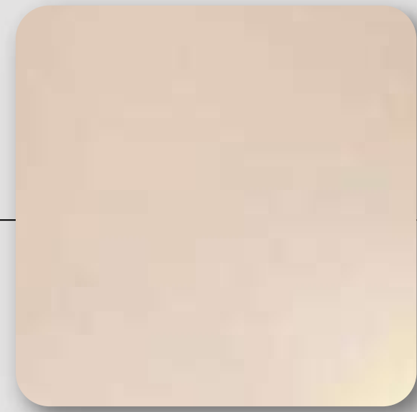
Muros interiores con pasta gyplast Plafones con pasta gyplast