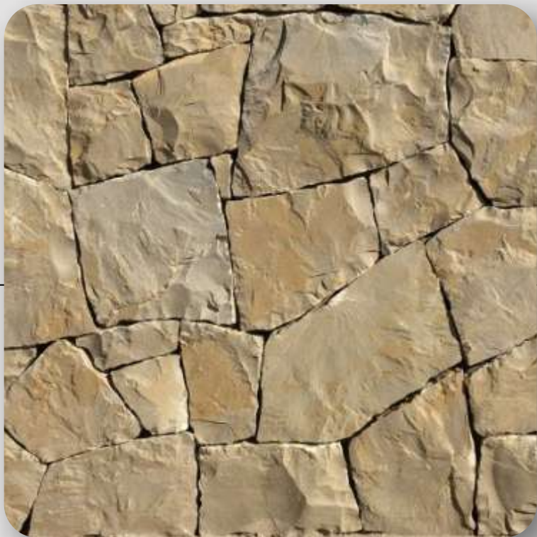
Muro cabecero de piedra careada con boquilla vaciada