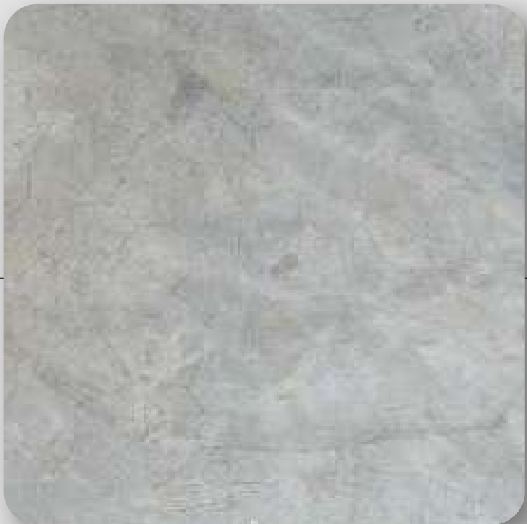
Piso de concreto pulido con matices gris oxford y blanco